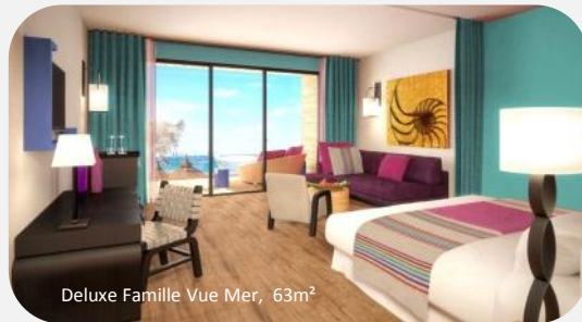
Deluxe Famille Vue Mer, 63m 2

Parmi ces chambres, il y a 30 chambres Club Famille Vue Mer , de 50 m 2 et 30 chambres Deluxe Famille Vue Mer de 63 m 2 , commercialisées à partir de l'été 2014