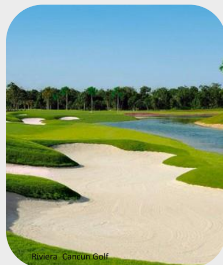
Riviera Cancun Golf