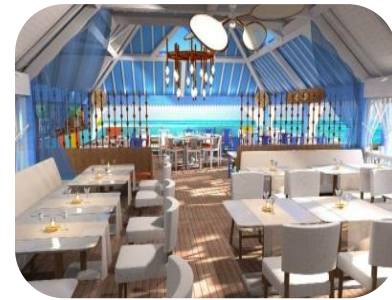
Le restaurant principal