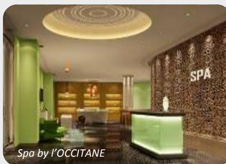
Spa by L'OCCITANE

Club Med Spa* by L'OCCITANE avec 10 cabines de soin . Piscine intérieure, Sauna et Salle de Fitness à disposition