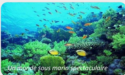
Un monde sous marin spectaculaire

A la carte : Jet ski*, parachute ascensionnel*, banana boat*