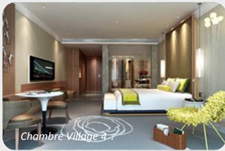
Chambre Village 4t