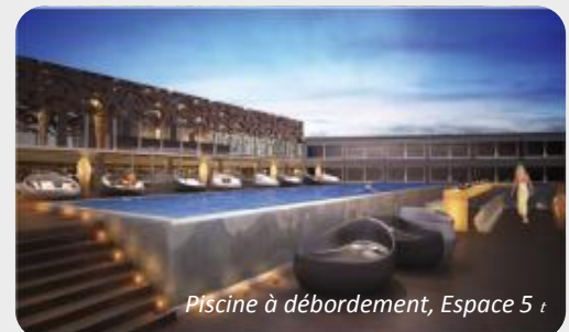
Piscine à débordement, Espace 5t