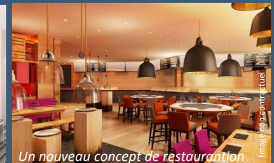
Un nouveau concept de restauration