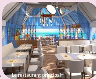
Le restaurant principal

A partir de novembre 2014 : Création d'un nouveau Spa avec un partenaire de renom : L'Occitane en Provence Rénovation et extension de «Le Christopher» restaurant principal Rénovation de la piscine principale Nouvelle activité à la carte : Le Kitesurf*