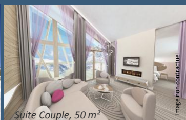
Suite Couple, 50 m 2