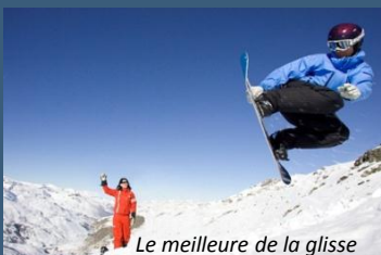
Le meilleure de la glisse