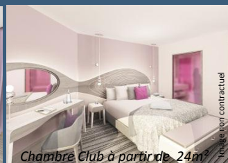
Chambre Club à partir de 24m 2