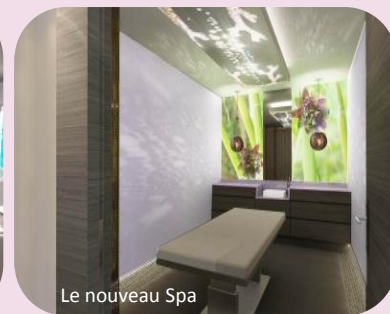
Le nouveau Spa